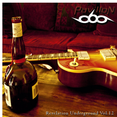
Compilation Pavillon 666 (vol. 12) (Décembre 2010)