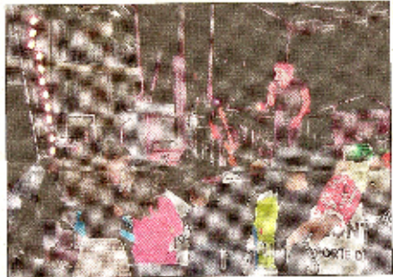
Le karaoké, c'est une bonne occasion de chanter pour le public.

Temps fort également, les cadeaux distribués au public, peu avant l'arrivée du fameux groupe que l'on voyait sur l'affiche : les Toon's.