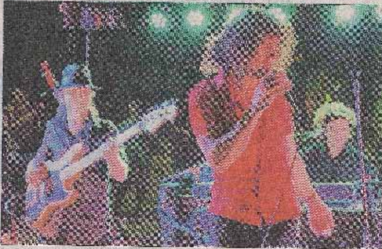
Les Toon's seront samedi soir au théâtre le Rhône. Entrée : 5€.