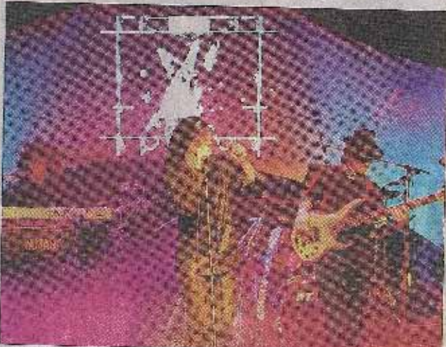
Les Toon's ont préparé un spectacle magique qu'ils présenteront le samedi 25 septembre au Théâtre Le Rhône.