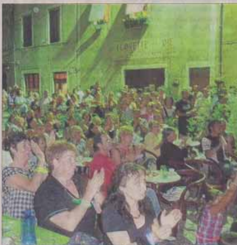
"Les Toon's" revisitent avec talent le répertoire de Daniel Balavoine.