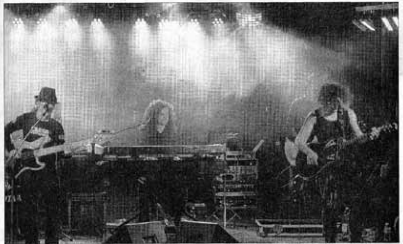
En avant-première, "Les Toons" on a présenté leur nouveau spectacle à une soixantaine d'invités privilégiés.

Pour plus d'infos et pour écouter l'univers des Toon's, rendez-vous sur www.lestoons.com et www.myspace.com/lestoons .